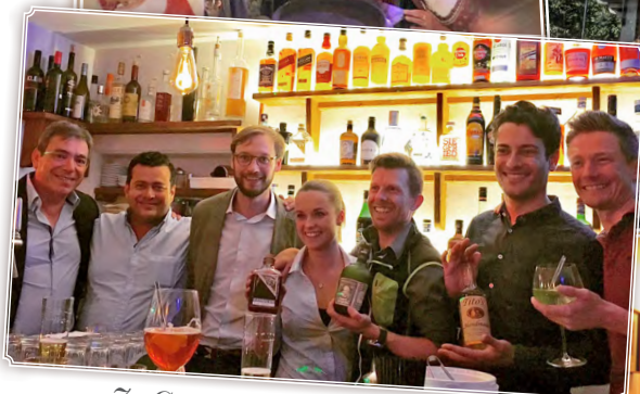
Zu Gast: Die Big Bosse Diplomático Rum, Titos Vodka und Elephant Gin!